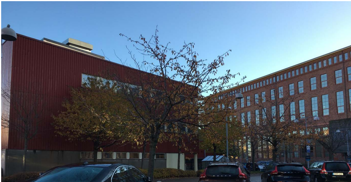
10. Del av trädrad av körsbär. Mot Ö.