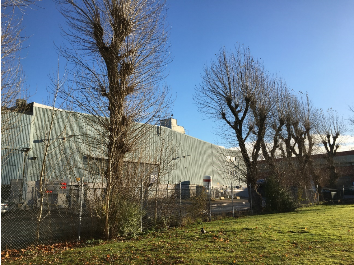
5. Del av trädrad av poppel. Mot SÖ.