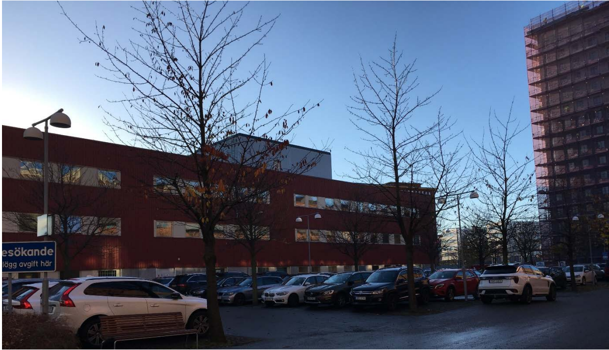
9. Del av trädrad av körsbär. Mot S.