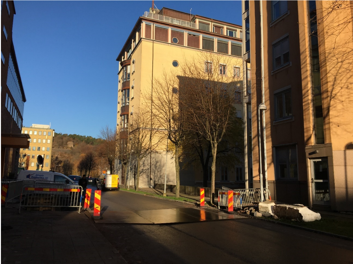
7. Del av trädrad av vitoxel på Regnbågsgatan, norra delen. Mot NV.