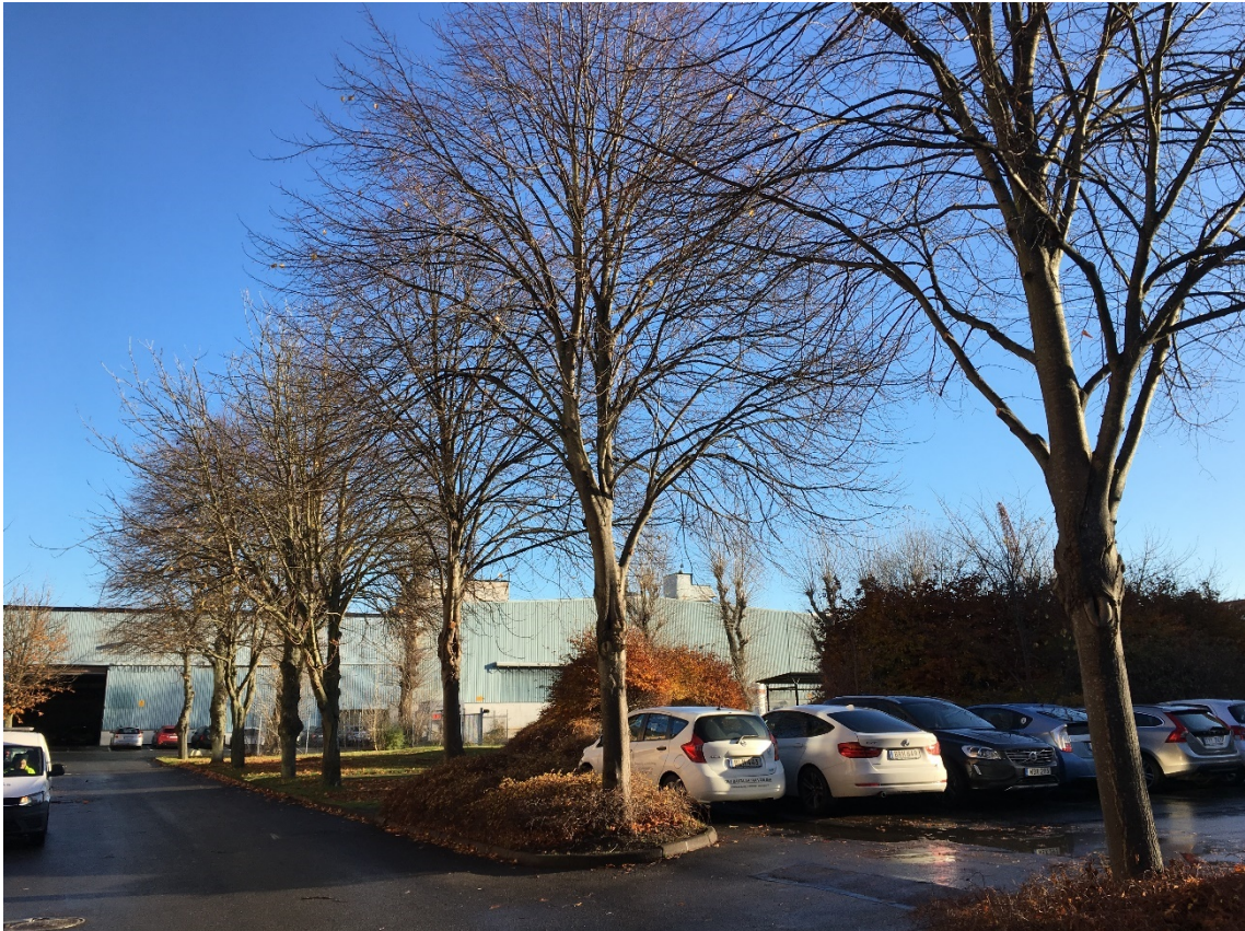
6. Del av trädrad av lind och hästkastanj. Mot NÖ.