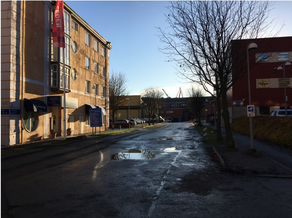
8. Trädrad av vitoxel på Regnbågsgatan, södra delen. Mot SÖ.