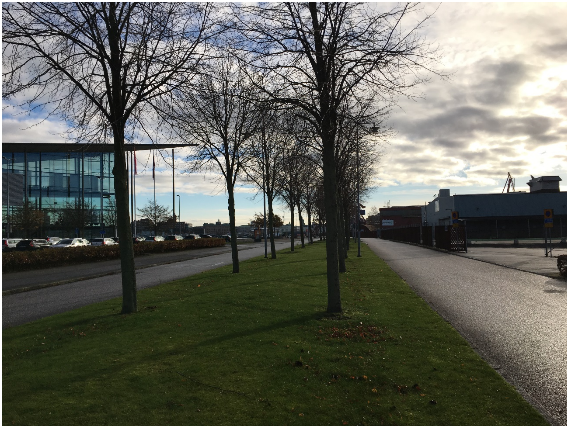
1. Del av Lindallé längs Pumpgatan. Mot SÖ.