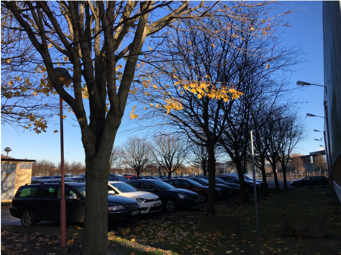
3 och 4. Trädrader av lönn. Mot NÖ.