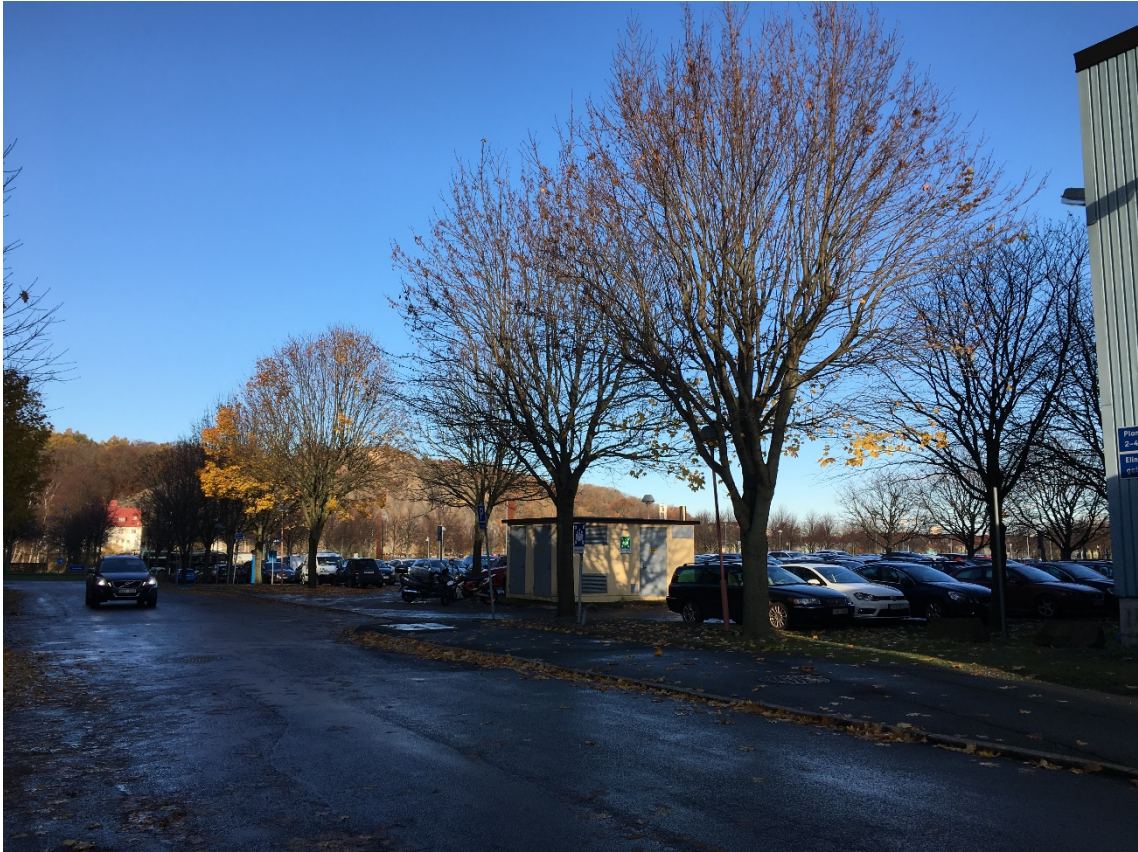
2. Trädrad av lönn. Mot NV.